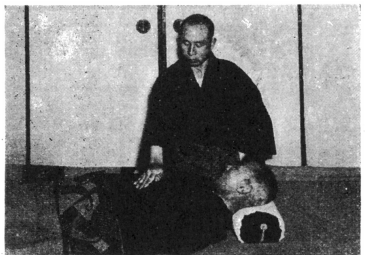
(法療治の胃 圖十三第)

Un immense merci à Masaé Kawai-Sudre pour la traduction du Japonais en Français